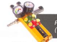
PRZELOTOWY PODWÓJNY STEROWNIK (MOŻLIWOŚĆ ŁĄCZENIA ZE SOBĄ)