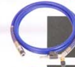
WĘŻ Z ZAWOREM ODCINAJĄCYM I ZAWOREM BEZPIECZEŃSTWA